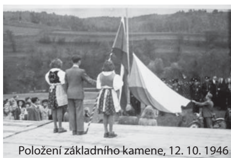
Položení základního kamene, 12. 10. 1946