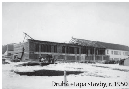
Druhá etapa stavby, r. 1950