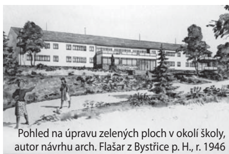
Pohled na úpravu zelených ploch v okolí školy, autor návrhu arch. Flašar z Bystřice p. H., r. 1946