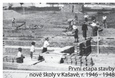
První etapa stavby nové školy v Kašavě, r. 1946 - 1948