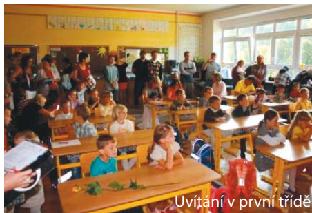
Uvítání v první třídě