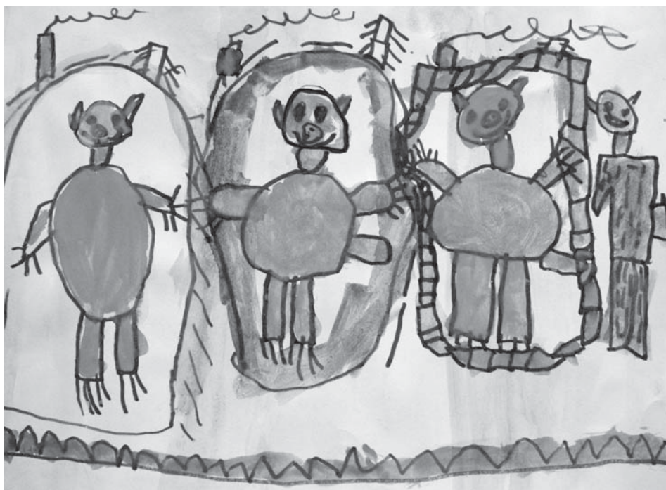
Posloucháme pohádku O třech prasátkách za deštivého počasí (Kubík Řezníček, 5 let)

I v příštím Okénku budete mít opět prostor pro vaši tvorbu. Tentokrát na téma VÁNOCE. Pokud se chcete zapojit a vyhrát nějakou hezkou cenu, posílejte své výtvary (slohové práce, básničky, obrázky) a odpovědi na soutěžní otázky na email redakce@kasava.cz nebo je předejte svým třídním učitelům ve škole do konce listopadu. Nejlepší zveřejníme a odměníme!