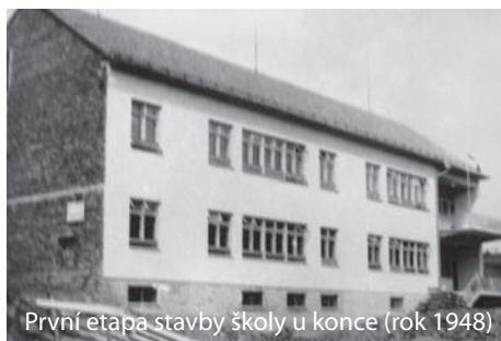
První etapa stavby školy u konce (rok 1948)