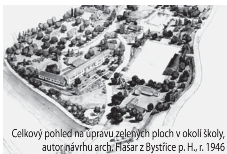
Celkový pohled na úpravu zelených ploch v okolí školy, autor návrhu arch. Flašar z Bystřice p. H., r. 1946