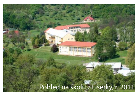
Pohled na školu z Físerky, r. 2011