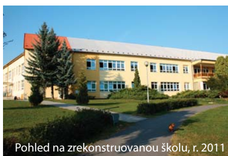
Pohled na zrekonstruovanou školu, r. 2011