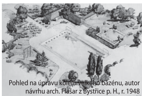
Pohled na úpravu kolem velkého bazénu, autor návrhu arch. Flašar z Bystřice p. H., r. 1948