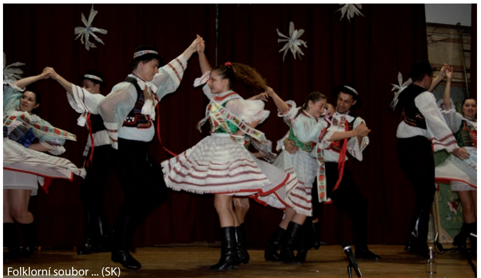
Folklorní soubor ... (SK)