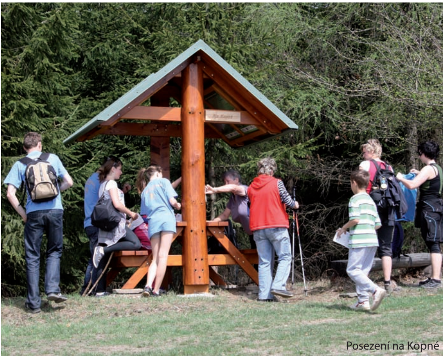
Posezení na Kopně