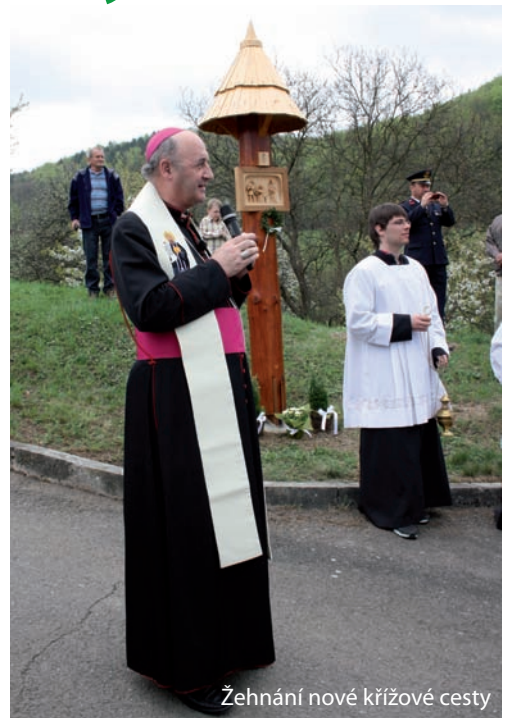
Žehnání nové křížové cesty