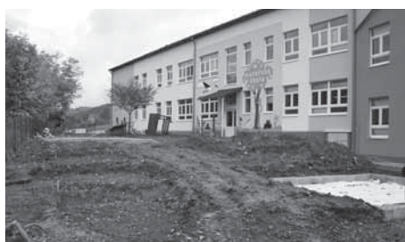
Výstavba dětského hřiště v přírodním stylu