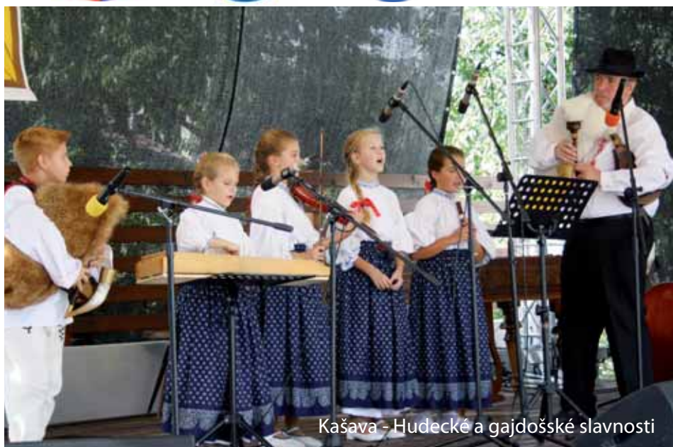
Kašava - Hudecké a gajdošské slavnosti