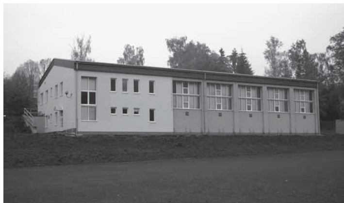
Zateplení a výměna oken u tělocvičny a přístavby školy