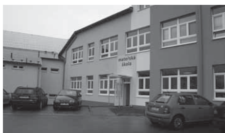
Nový vchod do mateřské školy a parkovací místa