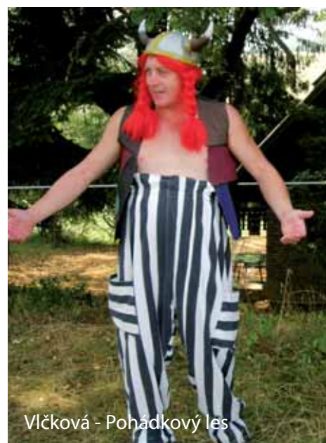
Vlčková - Pohádkový les