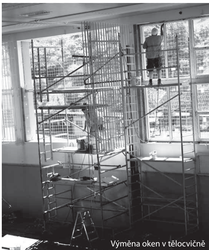
Výměna oken v tělocvičně