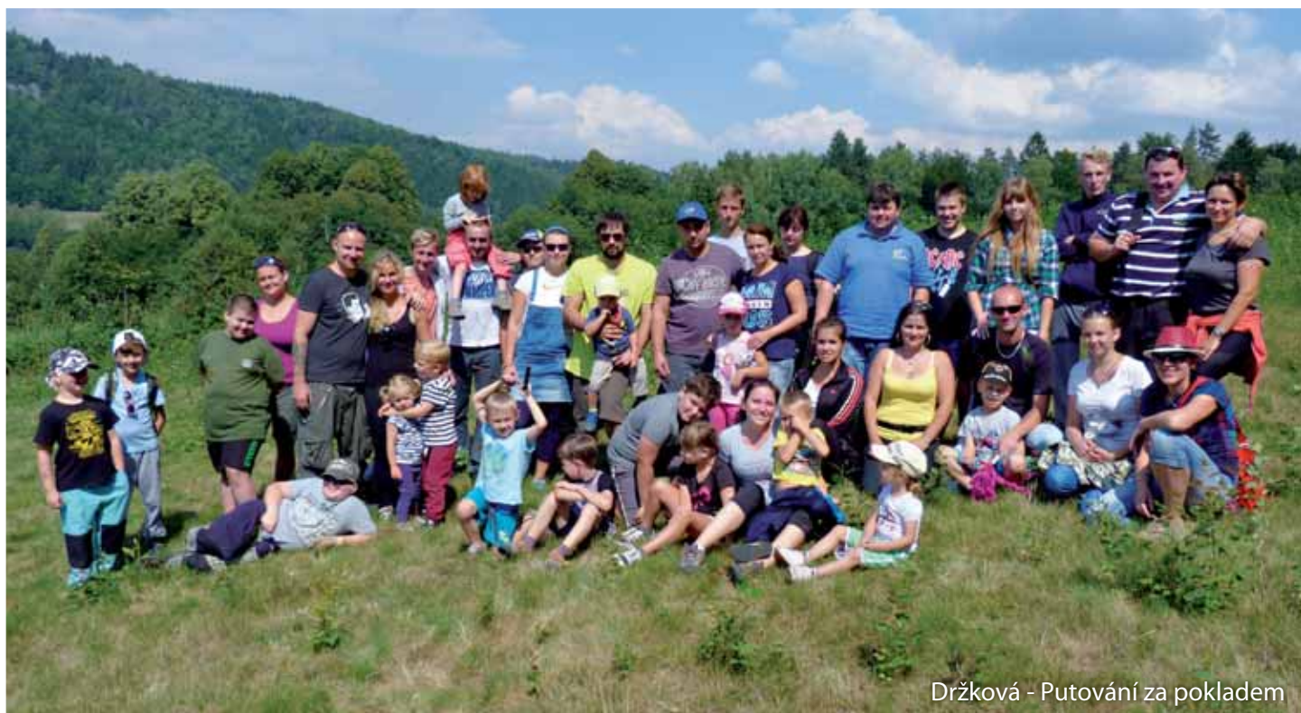
Držková - Putování za pokladem