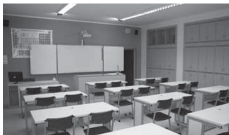
Nová odborná učebna fyziky a chemie