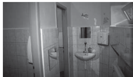
Zkrášlení žákovských toalet