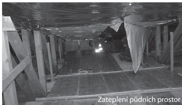
Zateplení půdních prostor